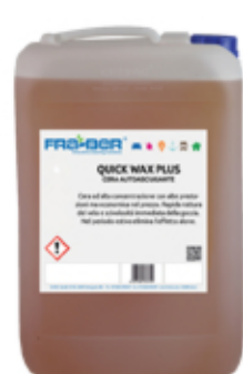
QUICK WAX PLUS: Cera