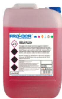
RESA PLUS+: champú cepillos