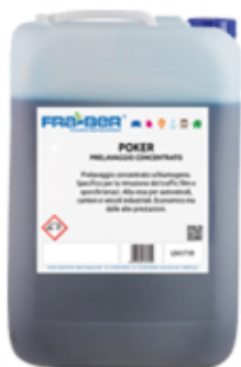
POKER: champú para cepillos