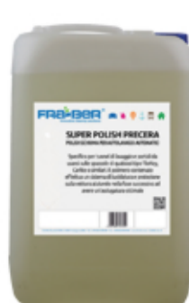
PRECERA EXTRA SCHIUMA: champú para cepillos