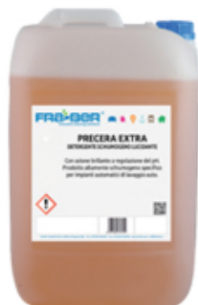
PRECERA EXTRA: espuma activa