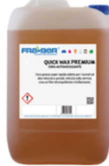
QUICK WAX PREMIUM: Cera