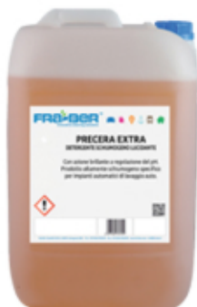
PRECERA EXTRA: espuma activa